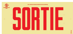
Sans chevrons directionnels

Le signal SORTIE certifié ULC est fourni avec des chevrons directionnels auto-adhésifs qui peuvent être utilisés pour indiquer une direction si nécessaire.