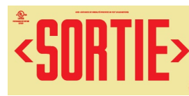
Avec chevron directionnel à gauche et à droite

Note: Le support adhésif utilisé dans les chevrons directionnels est un produit conforme à la norme pour les systèmes de marquage et d'étiquetage - UL 969.