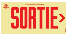
Avec un chevron directionnel à droite