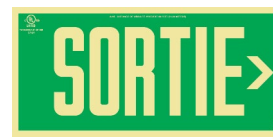
Avec un chevron directionnel à droite