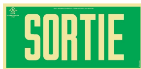
Sans chevrons directionnels

Le produit est fourni avec des chevrons directionnels auto-adhésifs photoluminescents.