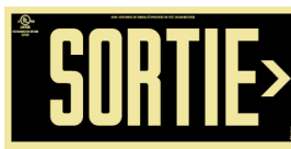
Avec un chevron directionnel à droite