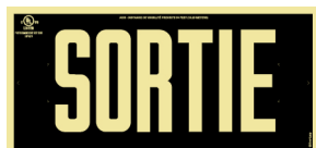
Sans chevrons directionnels

Le produit est fourni avec des chevrons directionnels auto-adhésifs photoluminescents.